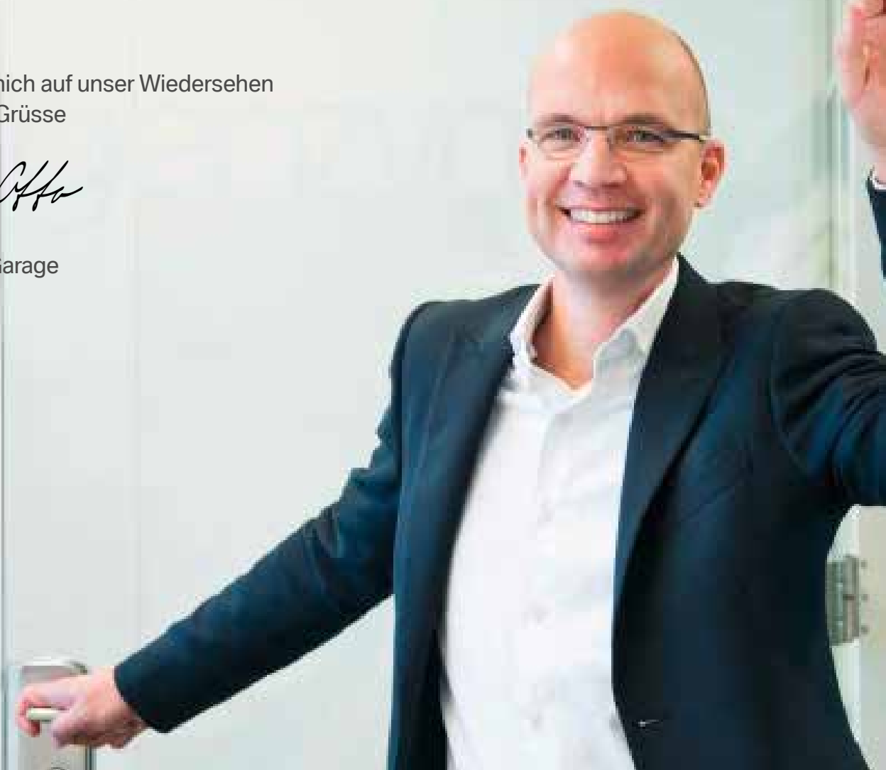
Rolf Otto Seeblick Garage